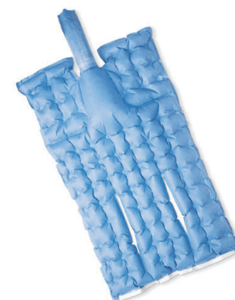
Manta cardíaca WarmTouch® CareDrape® (estéril)