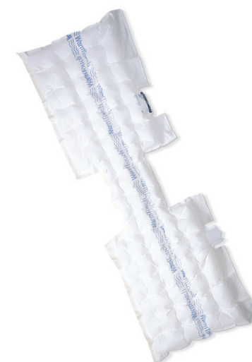
Manta para Parte Superior WarmTouch® CareDrape® cirúrgica