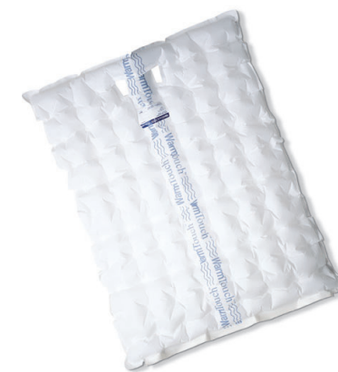
Manta para Parte Inferior WarmTouch® CareDrape® cirúrgica