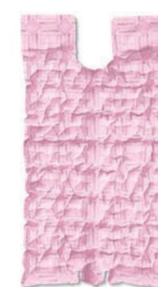
Manta para Corpo Inteiro, modelo pediátrico, WarmTouch® CareQuilt® pós- cirúrgica