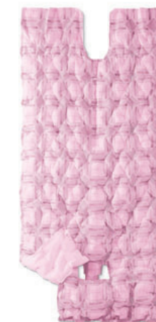
Manta para Corpo Inteiro, modelo adulto, WarmTouch® CareQuilt® pós- cirúrgica