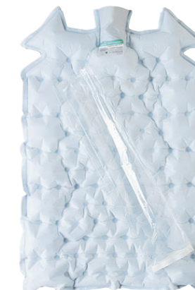
Manta Pediátrica WarmTouch® CareDrape® cirúrgica