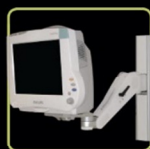
Suportes para equipamentos