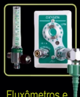
Fluxômetros e Reguladores